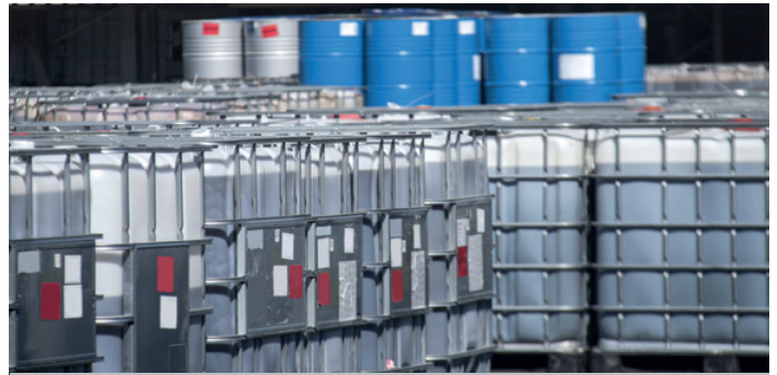
▲ Die MPT Sauglanze ist ein unverzichtbares Hilfsmittel für das reibungslose Chemikalienhandling

„ Wir haben nicht nur große Anlagen im Blick. Oft sind es kleine Komponenten, in denen unser Know-how und unsere Erfahrung zu Innovationssprüngen führen.“