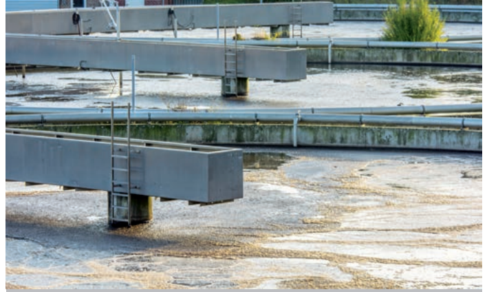
▲ Kläranlagen profitieren von gesenkten Verbrauchskosten bei der Schlammeindickung.

„ Wenn uns Komponenten-Lösungen nicht überzeugen, dann entwickeln wir eigene Marken.“